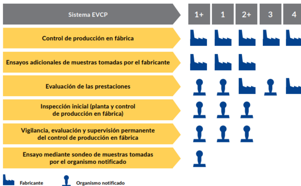
Imagen: esquema del funcionamiento de los diferentes sistemas EVCP existentes en el RPC. Obtenido del documento "MERCADO CE DE LOS PRODUCTOS DE CONSTRUCCIÓN PASO A PASO".

En este caso, en función del uso previsto del producto (ver Anexo ZA de la norma armonizada), el fabricante deberá usar el sistema 1 o el sistema 3 (o el sistema 4 de manera excepcional, según artículo 37 RPC):